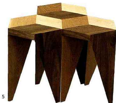
5. Rayuela Alvaro Catalán de Ocón