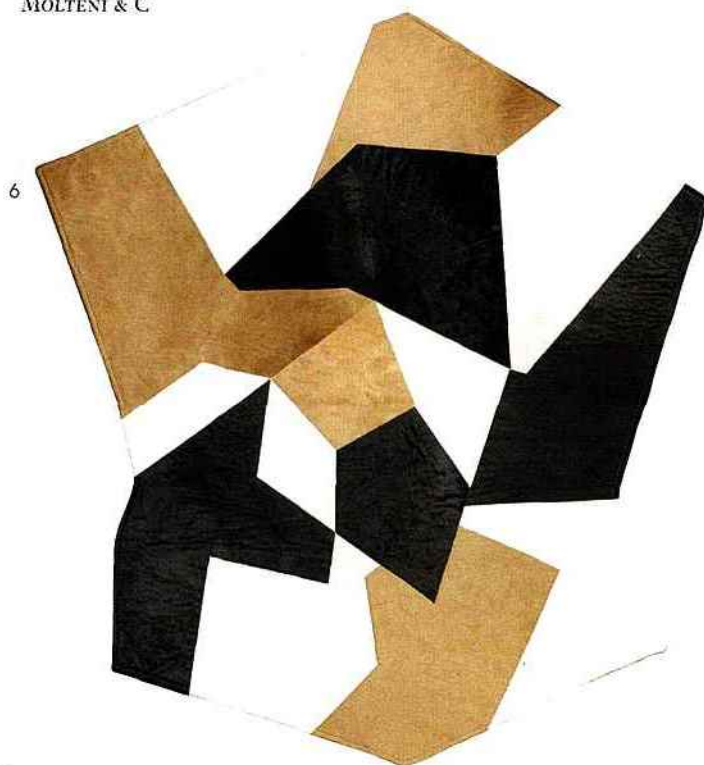
6. Ponti D754 Giò Ponti MOLTENI & C.