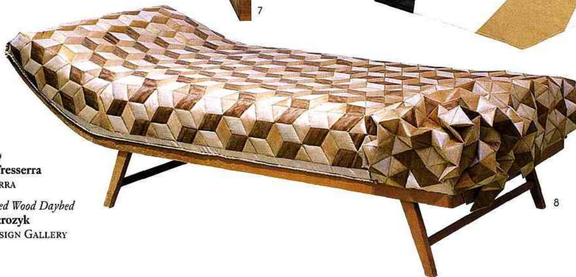
8. Quilted Wood Daybed Elisa Strozyk PLUSDESIGN GALLERY

blié le mobilier classique des châteaux de France ouvragé de dessins floraux rococo mêlant métaux, nacre, pierre et paille: la marqueterie nouvelle façon se fait plus abstraite. Elle renoue avec des compositions d'aplats de bois dans la tradition antique, voire de la Renaissance. Jean-Marc Gady imagine ainsi une écritoire façon cabinet florentin orné de rayures et de compositions en étoile. Une relecture moderniste des meubles tant appréciés par les cardinaux Farnèse et Mazarin ou le grand-duc de Toscane. RÉALISATION A.B., TEXTE C.S.A.P.