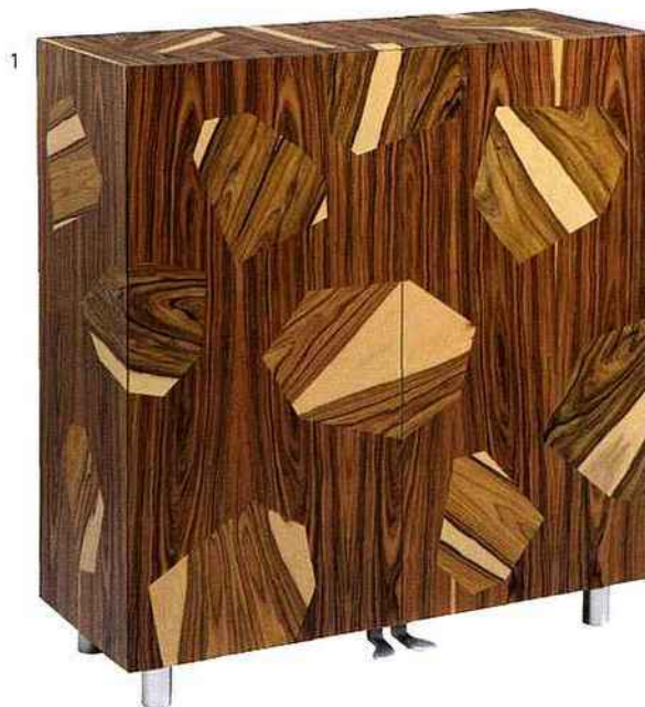
1. Bois de Rose Leopardo Massimo Morozzi EDRA